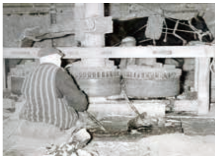
砂糖締め風景 (大内町三本松) 昭和30年代