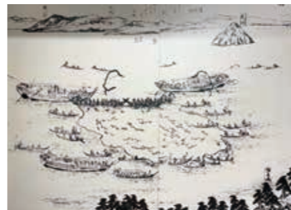
「鯛網乃図」『讃岐国名勝図会』