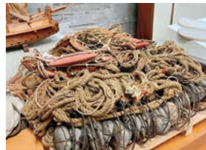
道具(タイ吾智網) / 瀬戸内海歴史民俗資料館蔵