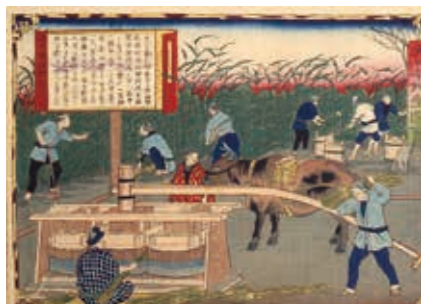
讃岐国白糖製造図 大日本物産図会 / 香川県立ミュージアム所蔵