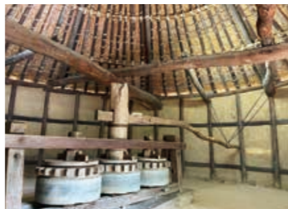
道具(砂糖車・砂糖締め小屋) / 四国村