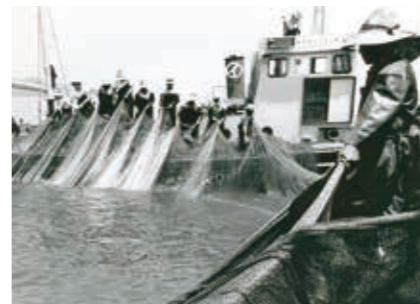
香川・庵治町鯛網